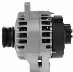
2 łapy montażowe (szeroka mocująca i wąska do naciągu)