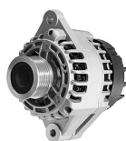
2 łapy montażowe (szeroka mocująca i wąska do naciągu)