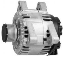
4 łapy montażowe