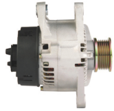
3 łapy montażowe