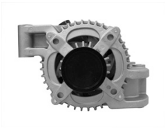
2 łapy montażowe (alternator mocowany poprzecznie)