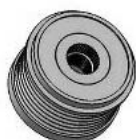
Koło pasowe sprzętowe (z wolnobiegiem). 6PK (6 rowków)