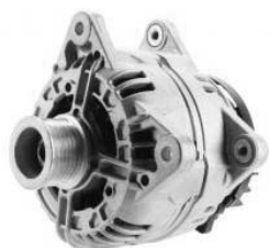
4 łapy montażowe