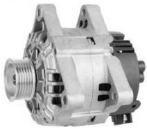
4 łapy montażowe