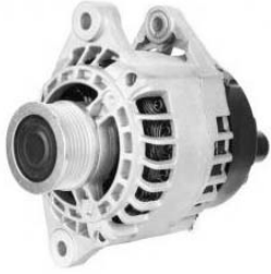
3 łapy montażowe