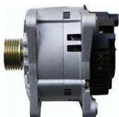
4 łapy montażowe