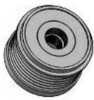
Koło pasowe sprzęgłowe z wolnobiegiem, 6PK (6 rowków)