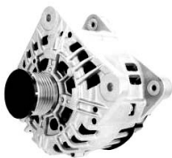
4 łapy montażowe