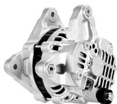
4 łapy montażowe